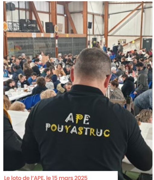
Le loto de l'APE, le 15 mars 2025

1 er mai Tournoi de rugby Challenge Daverède /Cazalet