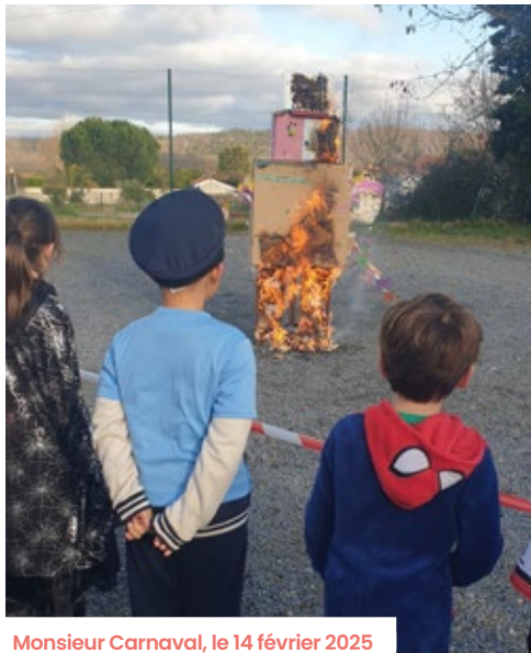
Monsieur Carnaval, le 14 février 2025