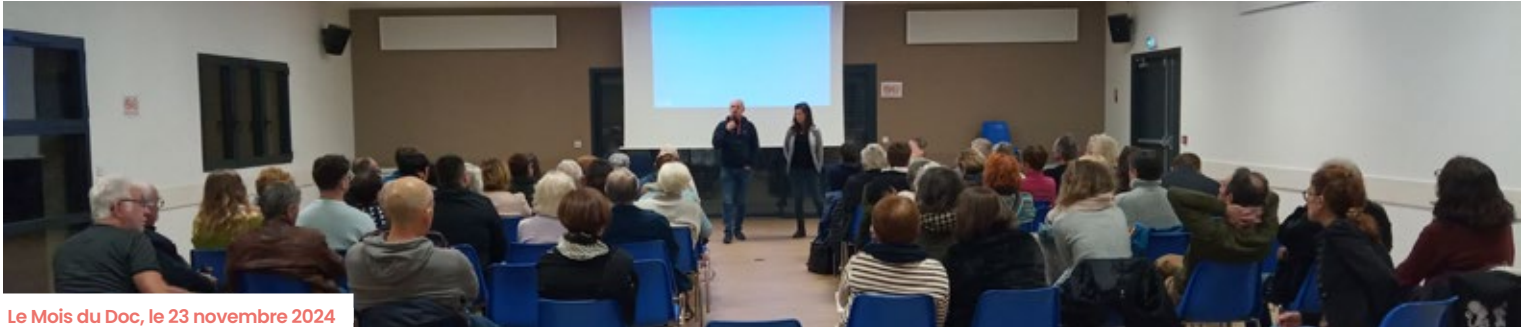
Le Mois du Doc, le 23 novembre 2024