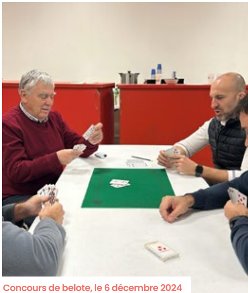
Concours de belote, le 6 décembre 2024